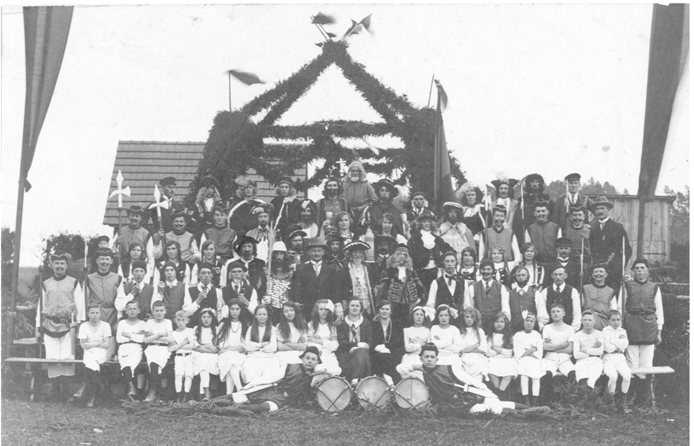
Eierlesen in Dettingen 1927